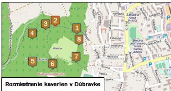
Rozmiestnenie kaverien v Dúbravke